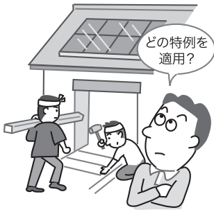
図表1 税額控除の種類

個人が、住宅の新築や購入又は増改築等を行った場合、一定の要件を満たす時には、五種類ある税額控除のいずれかを適用することによって、居住の用に供した年分以後の各年分の所得税額から一定金額を控除することができます。 ただし、どの税額控除を適用するか判断が難しいところがありますので、今回、ポイントを整理してみます。